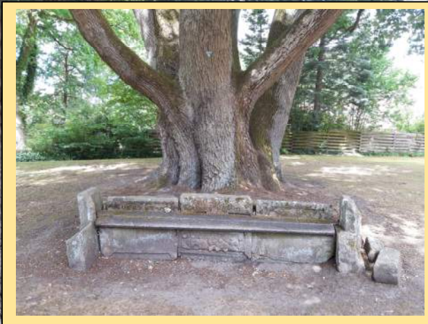
Text und Fotos: Rolf Alpers

Neben der Feldsteinkirche in Eimke wächst eine gewaltige Stieleiche, die mit einem Umfang von 7,80 m nach der Ebstorfer Königseiche die zweitdickste im Landkreis Uelzen ist. Der Umfang wurde in 70 cm Höhe („Taille“) gemessen; bereits in dieser geringen Höhe spaltet sich der Stamm zunächst in 4, in größerer Höhe dann in viele weitere starke Äste auf. Möglicherweise handelt es sich um mehrere einzelne Bäume, die später zu einem einzigen zusammengewachsen sind. Von 1993 bis 2022 hat der Umfang der vitalen und wuchskräftigen Eiche um 50 cm zugenommen. Das Alter wird mit 400 oder mehr Jahren angegeben, lässt sich mangels verlässlicher Quellen aber nicht wirklich bestimmen. Die Eiche ist als Naturdenkmal ND UE 046 ausgewiesen.