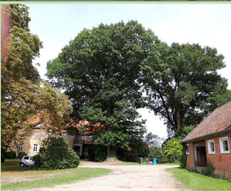
Roteiche (links) und Stieleiche (rechts)