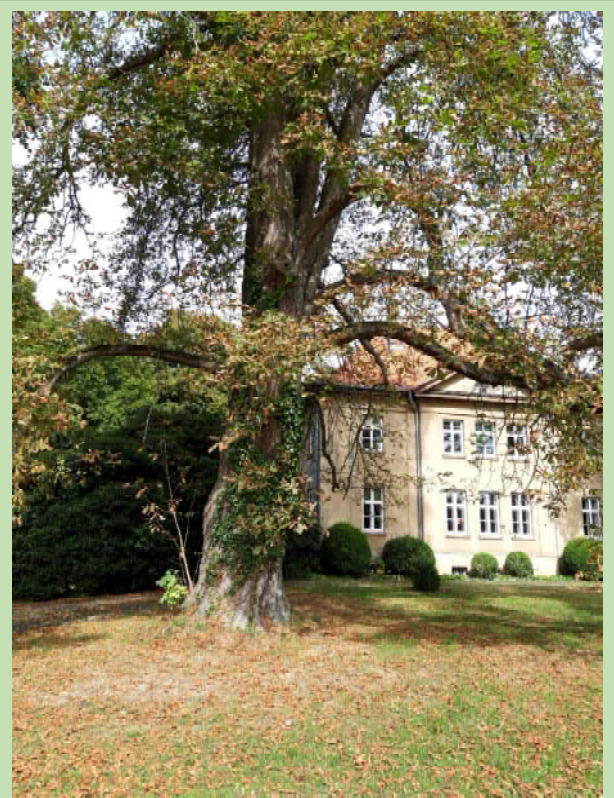
Rosskastanie vor dem Gutshaus