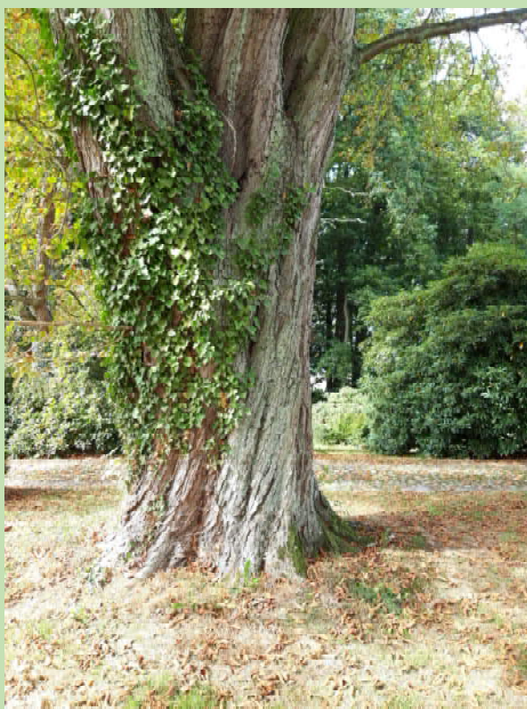
Stamm der Rosskastanie