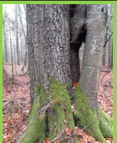
Rotbuche mit Symphyse