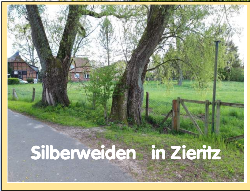
Silberweiden in Zieritz