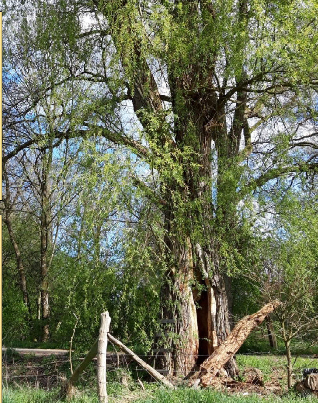
Text und Fotos: Rolf Alpers

Der Weg vom nördlichen Zieritzer Dorfrand in Richtung Göhrde wird von einigen monumentalen Eichen und Weiden gesäumt. Die 4 mächtigsten Silberweiden haben Brusthöhenumfänge von 3,85 m, 4,45 m, 5,05 m und 6,05 m. Zwei der Weiden sind hohl. Am Wegrand gegenüber stehen zwei Stieleichen von 3,35 m und 6,05 m Umfang.