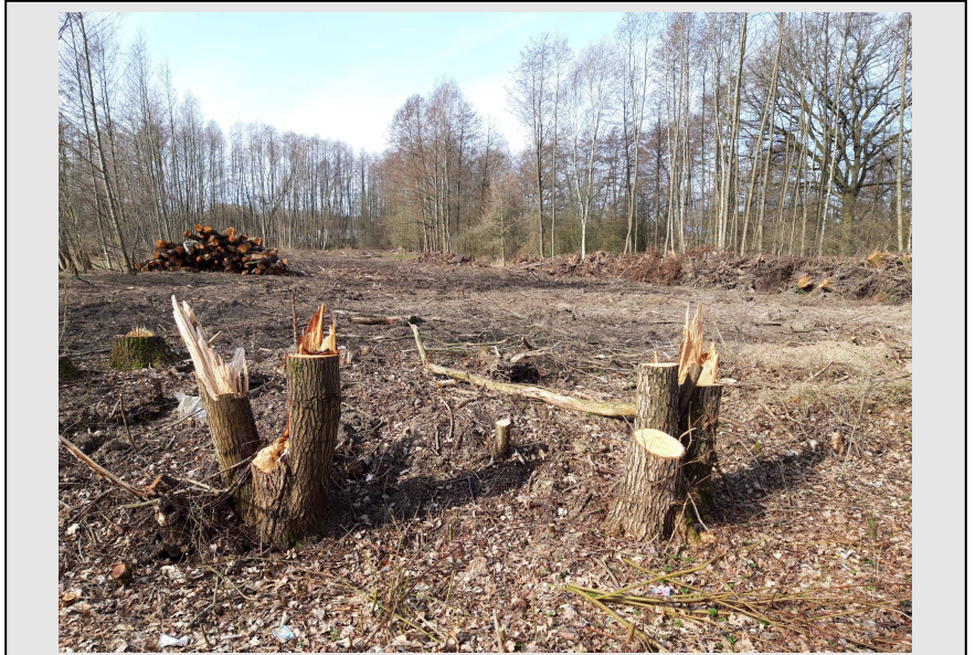
abgeholzter Erlenbruchwald im Breidenbeck

Was den aufmerksamen und empathischen Beobachtern im Februar 2021 in und vielleicht auch um Uelzen herum aufgefallen ist, kann man nur als „Kettensägen-Massaker“ bezeichnen. Die örtliche Zeitung berichtete und darin waren unter Umständen noch nicht einmal alle Fäll-Aktionen benannt. Auch viele Leserbriefe bezeugten eine erboste