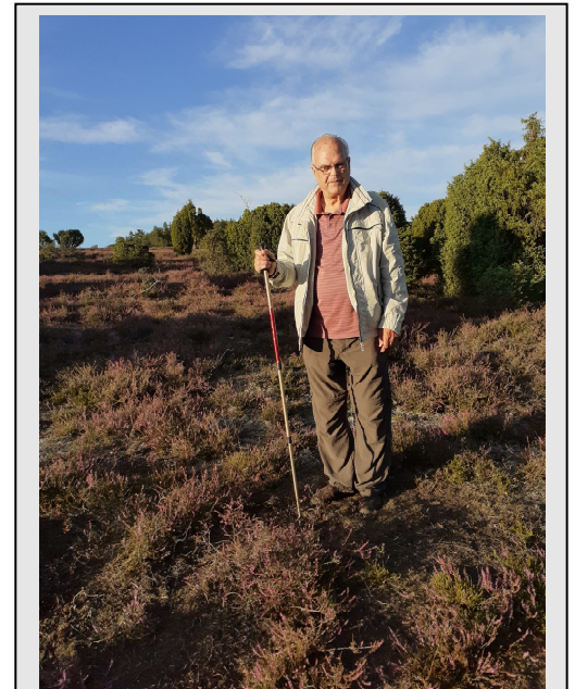
in der geliebten Ellerndorfer Heide

Durch meine vielen Vogelbeobachtungen und Exkursionen mit Ornithologen hatte ich den Wunsch Vögel zu beringern . Als ich 18 Jahre alt war, bekam ich die amtliche Erlaubnis für die Vogelwarte Helgoland zu arbeiten. Ich war vor allem auf Singvögel spezialisiert und habe von 1955 -1959 mehr als 700 Vögel beringt. Besonders