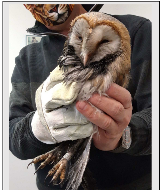
Am 4.1.2021 wurde diese Schleiereule entkräftet, verschmutzt und durchnässt in Lehmke gefunden und von unserem Fahrdienst in das Artenschutzzentrum Leiferde gebracht.