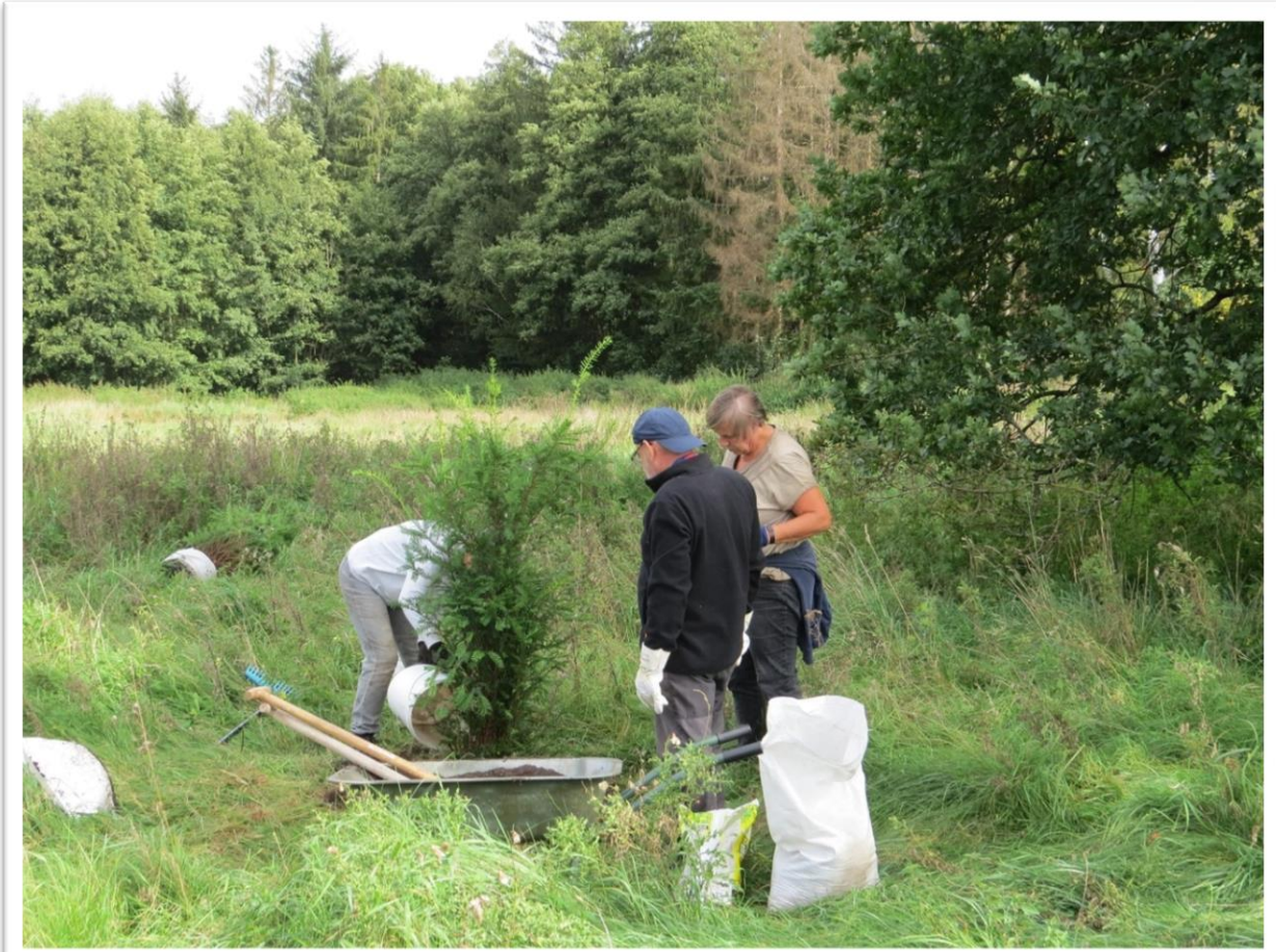
Im Schatten der alten Eiche entsteht ein Eibenwäldchen.

In der freien Natur ist die Eibe selten und zählt zu den gefährdeten Arten. Biologisch ist die Eibe eine Mischform zwischen Laubhölzern und immergrünen Nadelhölzern. Sie altert extrem langsam, ihr Holz ist langlebig, widerstandsfähig und gleichzeitig biegsam. Deswegen stellten schon die Alemannen und Wikinger Bogenwaffen aus Eibenholz her. Die Eibe gehört zu den Taxus-Arten. Der lateinische Begriff Taxus ist vom griechischen toxon (= Bogen) übernommen worden, und Toxikum (griech. toxikon ) heißt Gift. Same, Rinde und Nadelwerk der Eibe sind außerordentlich giftig. Die Eibe ist mit ihrem knorrigen, wandelbaren Aussehen etwas ganz Besonderes. Seit dem Altertum gilt sie als Baum des Todes und ist deshalb oft auf Friedhöfen zu finden. Auch Zauberkräfte sagte man ihr nach, sie wurde als Schutz vor Hexen und bösen Geistern ums Haus herum gepflanzt. Bei den Kelten war sie der Baum der Druiden, und neuerdings wird aus ihren Nadeln ein Elixier hergestellt, das in der Krebstherapie Anwendung findet.