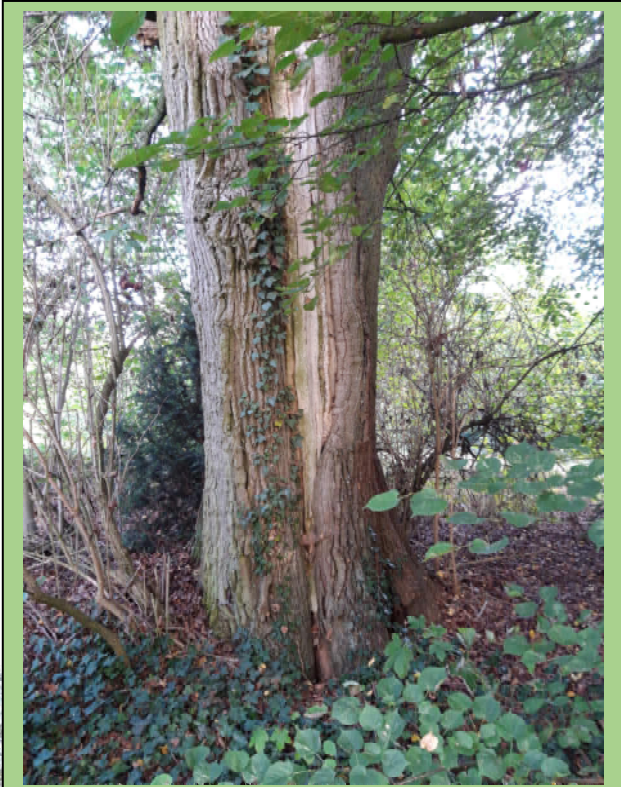
Stamm der 6 m dicken Eiche