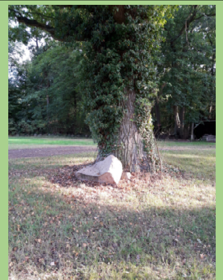
Stamm der kleineren Eiche