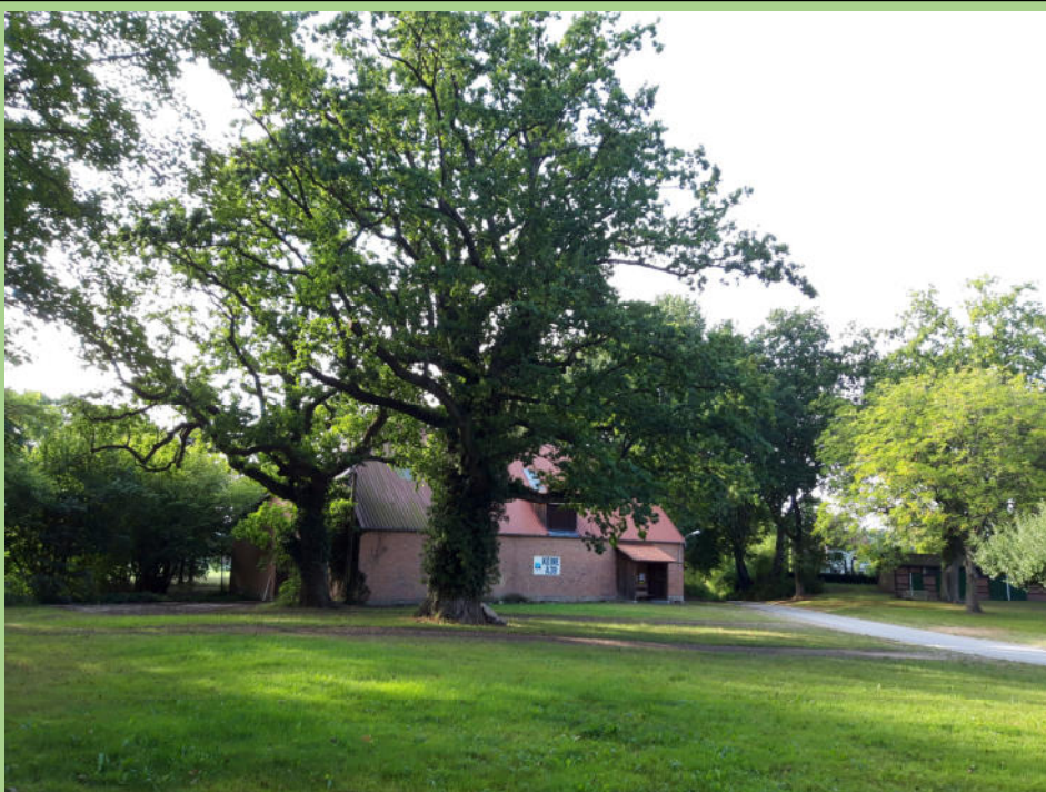
Eiche in der Dorfmitte mit 4,90 m Umfang sowie ein kleineres Exemplar