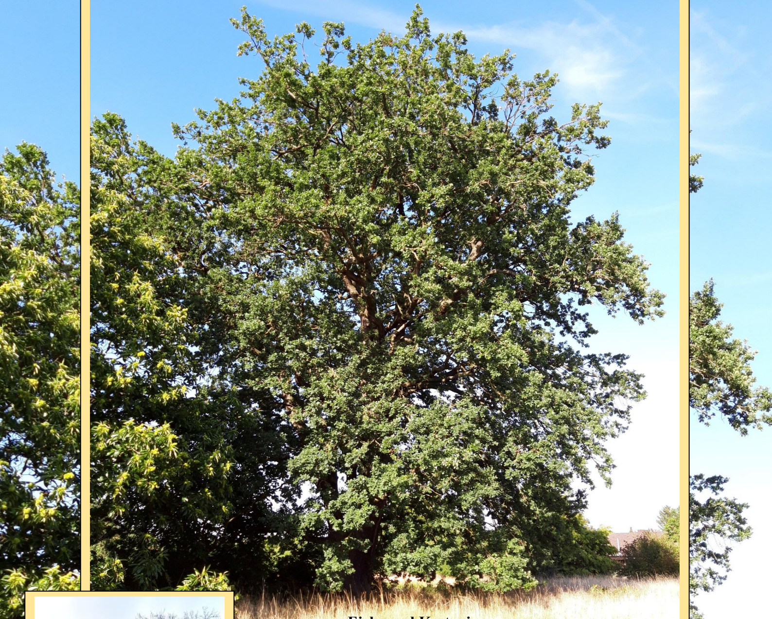
Eiche und Kastanie