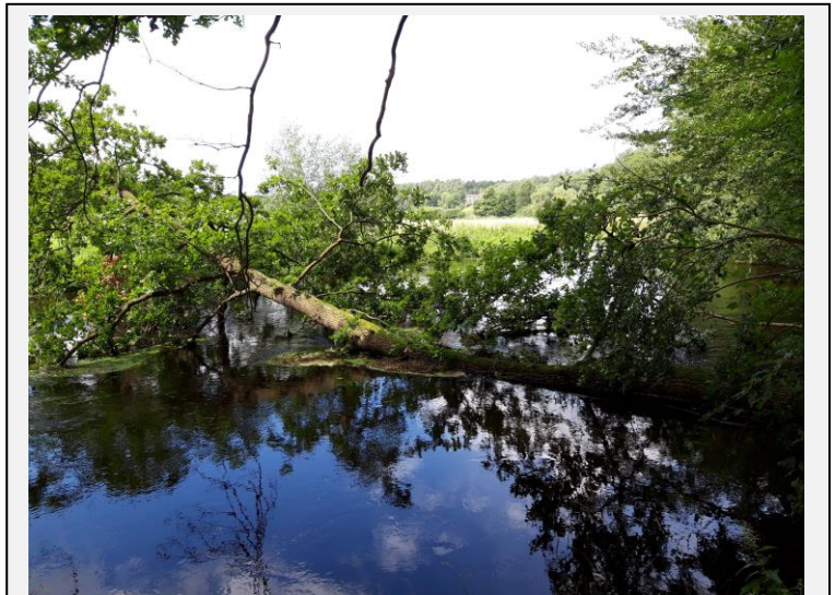
Ilmenau bei Bienenbüttel

Für den Naturschutz ist die Ilmenau einer der bedeutendsten Tieflandflüsse Niedersachsens. Zusammen mit Luhe und Neetze bildet das Gebiet einen weit verzweigten, miteinander verbundenen Fließgewässerkomplex mit Auenlebensräumen. Arten wie die Bachmuschel, Flussperlmuschel, diverse Fische und Rundmäuler, Grüne Flussjungfer und Fischotter finden hier ein Zuhause und haben hier zum Teil ihren Verbreitungsschwerpunkt. In diesem Bereich hat die Ökologische Station „Flusslandschaft Ilmenau, Luhe und Neetze“ – die sich in der Trägerschaft des BUND Niedersachsen befindet – Anfang 2023 ihre Arbeit aufgenommen. In Kooperation mit den Unteren Naturschutzbehörden der Landkreise Lüneburg, Harburg, Uelzen und Celle betreut die Station eine Fläche von 8.500 Hektar, in