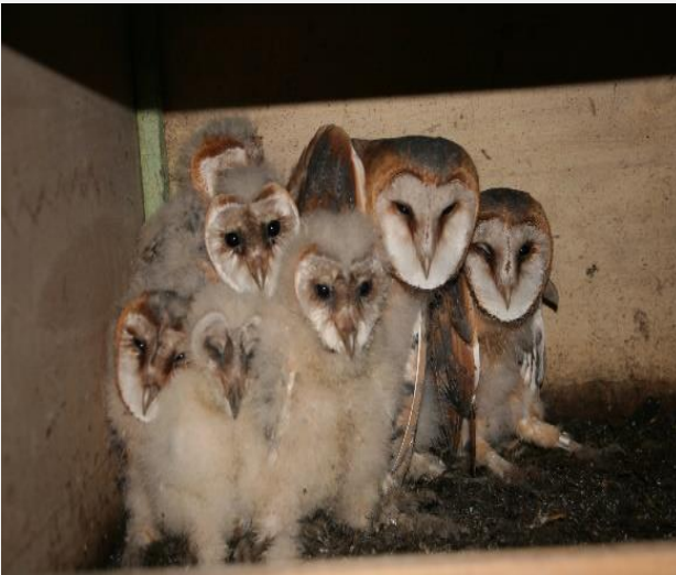
Schleiereulen im Nistkasten