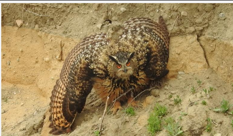
Uhu im Landkreis Uelzen