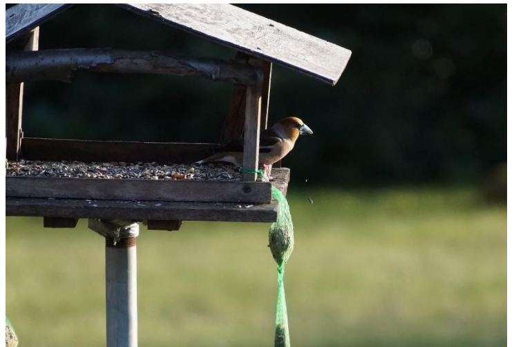
einen Schwarm Bergfinken und einen Kernbeißer fotografierte Barbara Kaiser am Futterhaus