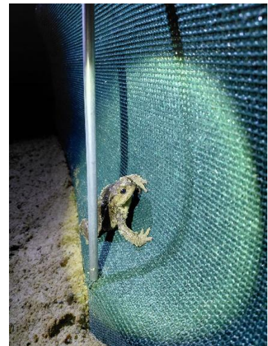
Erdkröte am Zaun