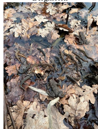
Ausbeute eines Tages