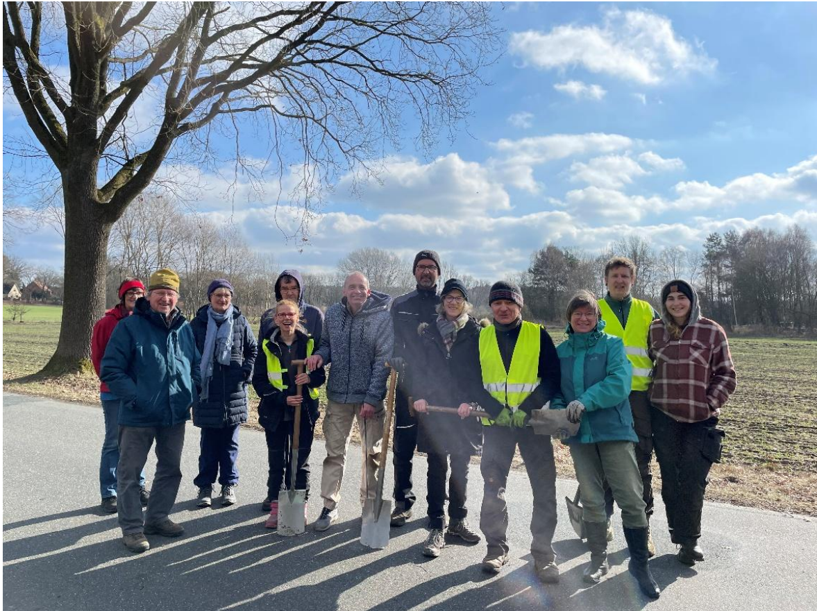
Die Ehrenamtlichen beim Aufbau des Zauns am 1.3.2026