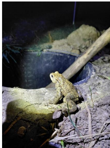
Erdkröte am Fangeimer