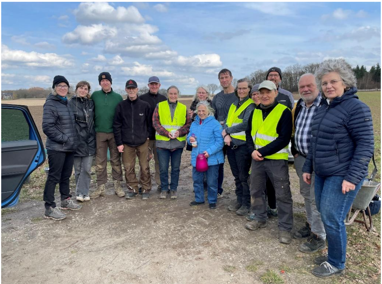
Die Ehrenamtlichen beim Aufbau des Zauns am 28.2.2026